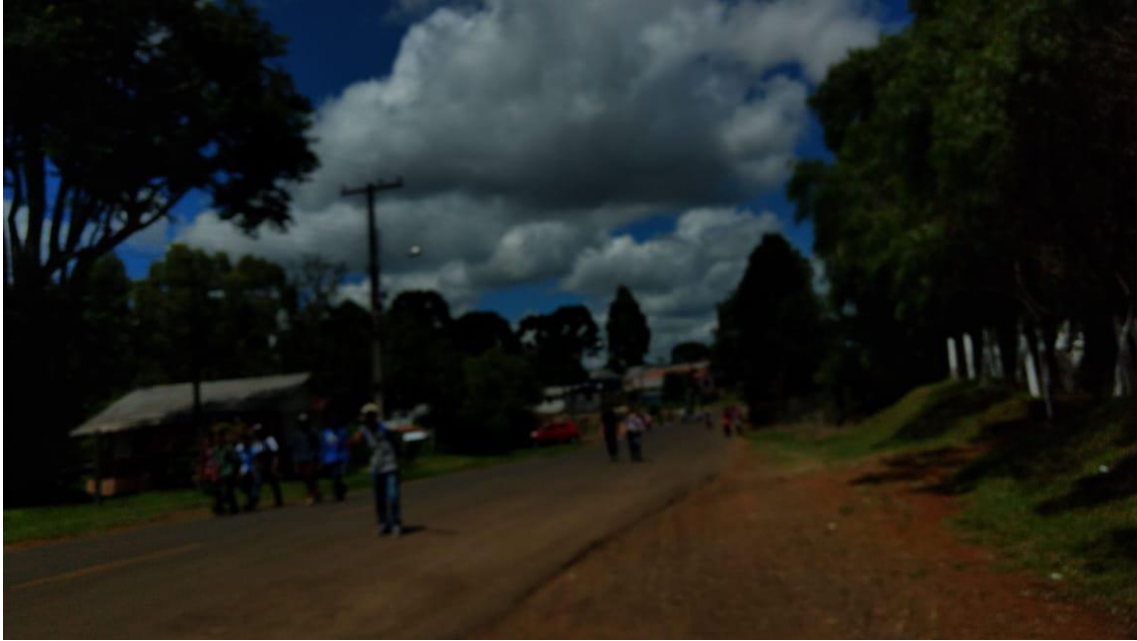
Alunos e professores panfletando casas na Rua Rui Barbosa, sentido Colégio até o trevo.