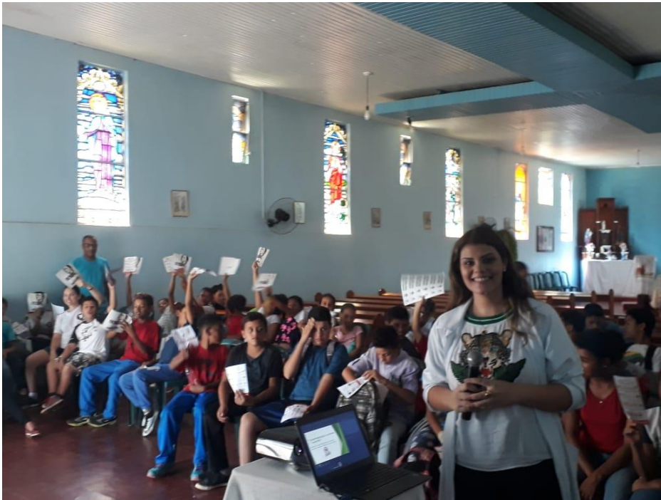
Continuidade ao evento, nos períodos vespertino e noturno.